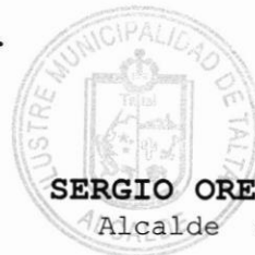
SERGIO ORELLANA MONTEJO Alcalde de la Comuna