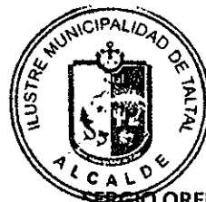
SERGIO ORELLANA MONTEJO Alcalde de la Comuna